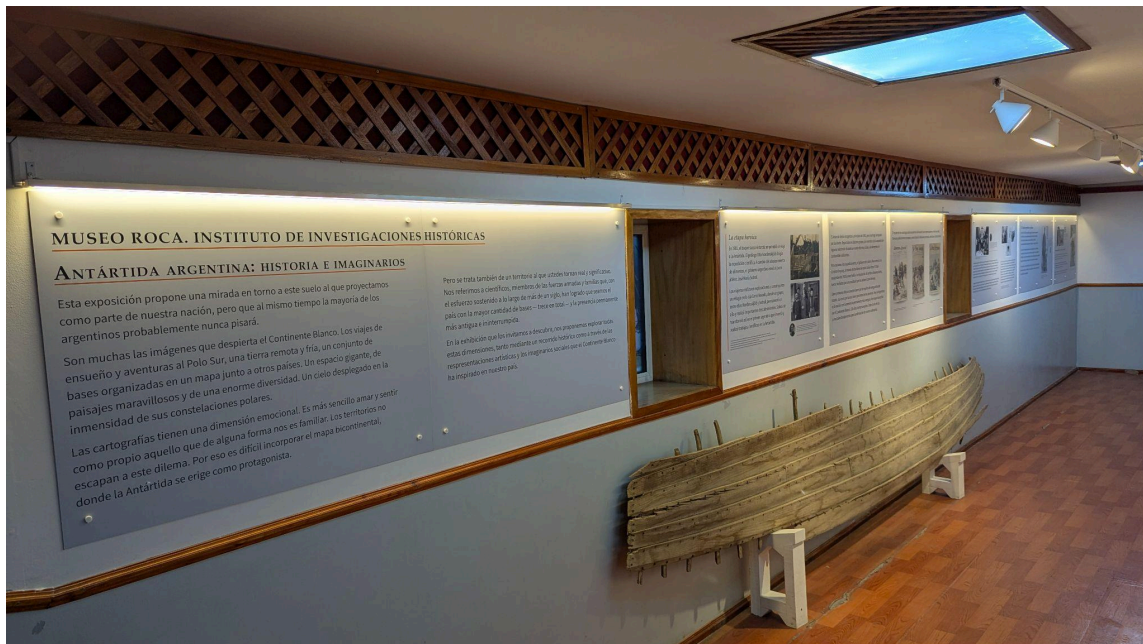
Fotografías de la muestra en el Museo Roca en la Ciudad Buenos Aires.