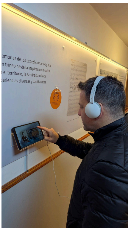
Fotografías de la muestra en la Base Marambio.